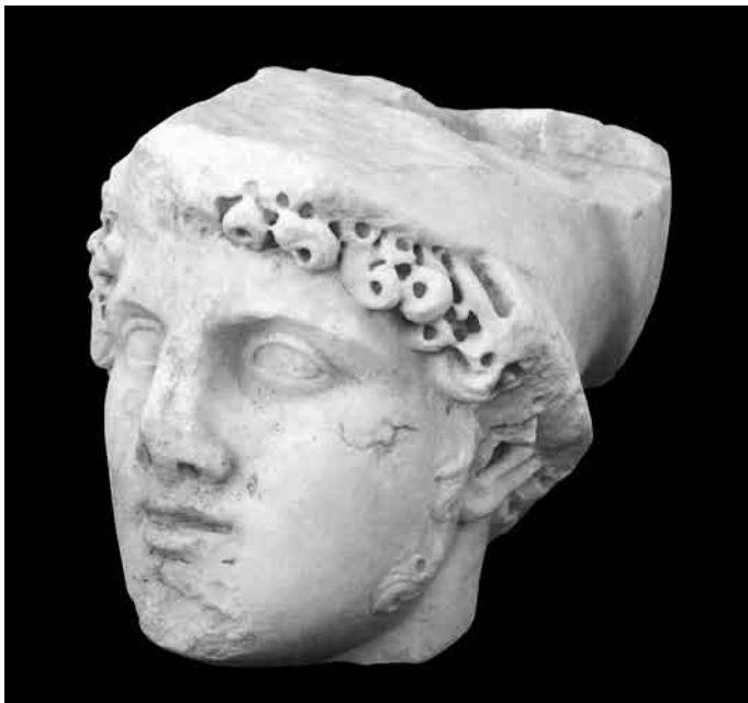
9. Cabeza masculina con casco.