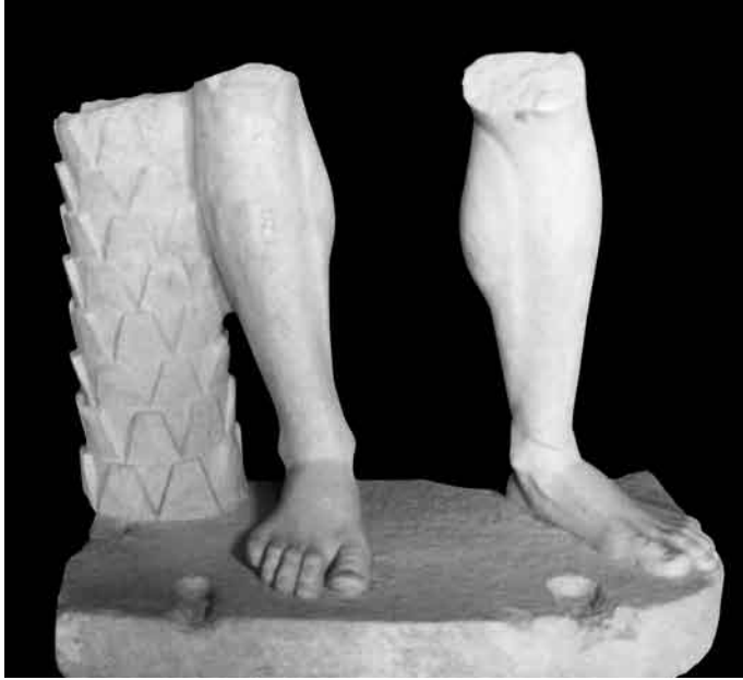
8. Piernas masculinas asociadas a soporte arbóreo.