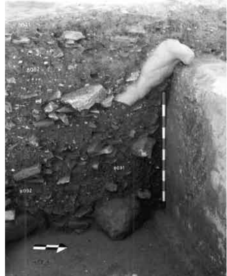
6. Contexto de aparición del torso masculino.

La adquisición de este conjunto de estatuaria entraría posiblemente dentro de ese primer aporte evergético que da lugar a la construcción del propio conjunto termal, quizás favorecido por algún patrono imperial; recuérdese la cabeza de príncipe julio-claudio de cronología tardoaugustea 43 y la de Vespasiano 44 , ambas de Écija. Esto nos enlaza con las corrientes de estatuaria ideal de época Julio Claudia 45 y con