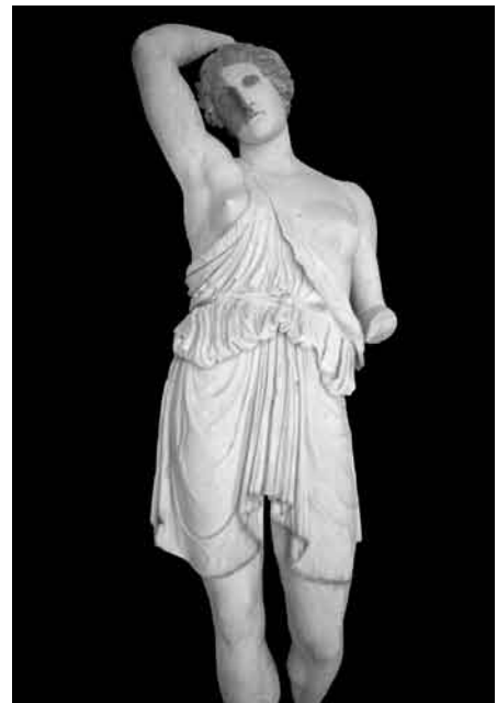
4. Amazona en proceso de limpieza y consolidación de pigmentos cromáticos.