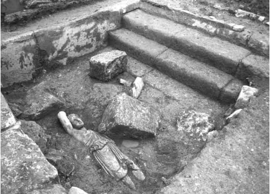
3. Contexto de aparición de la Amazona.