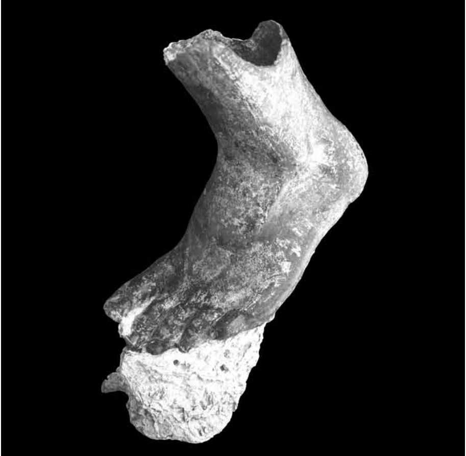
10. Pie de bronce dorado.