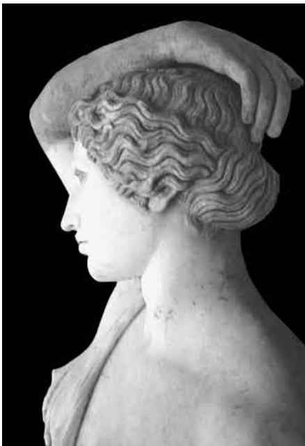
5. Amazona, perfil izquierdo.