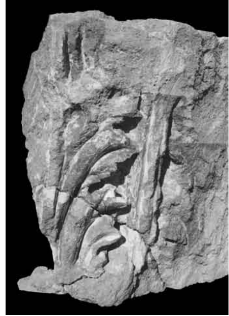
2. Capitel corintio itálico, de arenisca estucado.